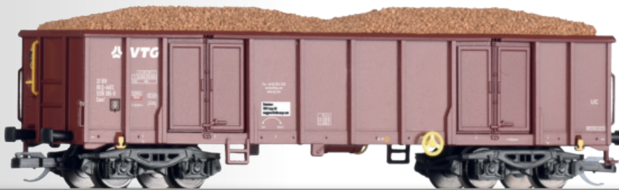
Offener Güterwagen Eaos der VTG, beladen mit Rüben Open car Eaos of the VTG with load