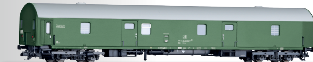
Bahnpostwagen Post m der Jugoslawischen Post Mail waggon Post m of the Yugoslavian Post