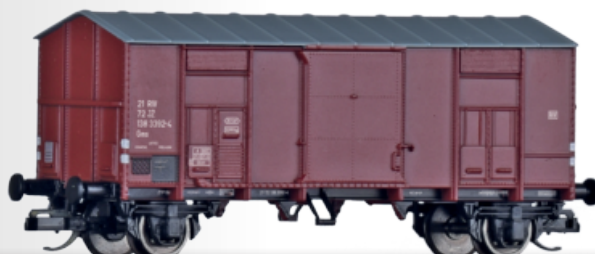
Gedeckter Güterwagen Gms der JZ Box car Gms of the JZ