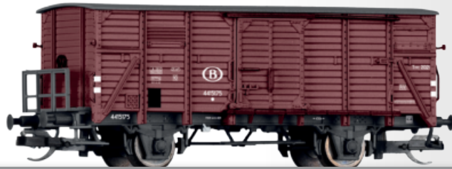
FORMVARIANTE: Gedeckter Güterwagen Type 2021A der SNCB NEW: Box car Type 2021A of the SNCB • Mit Bremserbühne / With brakeman's platform