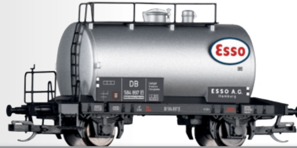
Kesselwagen „ESSO AG“, eingestellt bei der DB Tank car “ESSO AG” of the DB