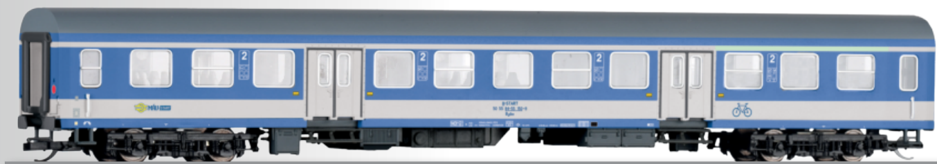
Reisezugwagen 2. Klasse mit Fahrradabteil Bydee, Typ Halberstadt, der MAV-Start 2nd class passenger coach Bydee, type Halberstadt, of the MAV-Start