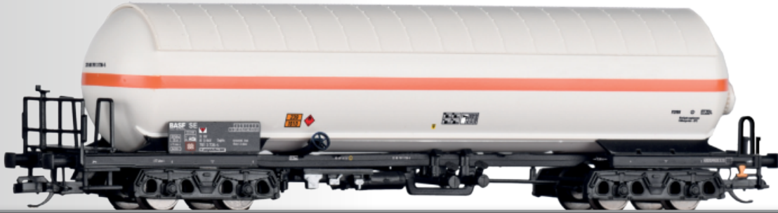
Gaskesselwagen Zagkks der BASF Gas tank car Zagkks of the BASF