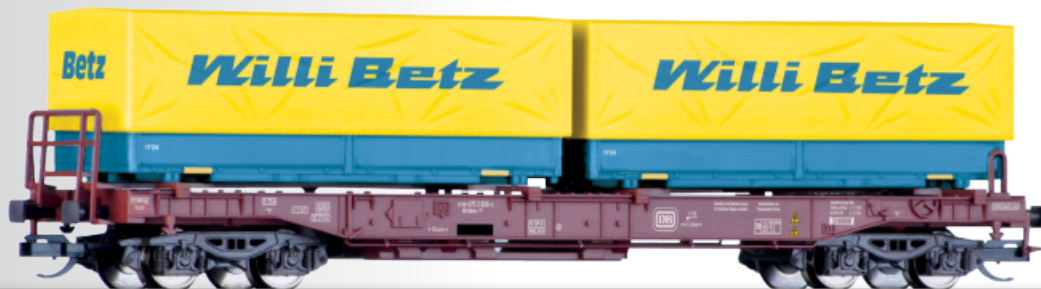
Taschenwagen Sdkms 707 der DB, beladen mit Wechselpritschen „Willi Betz“ Pocket wagon Sdkms 707 of the DB with load