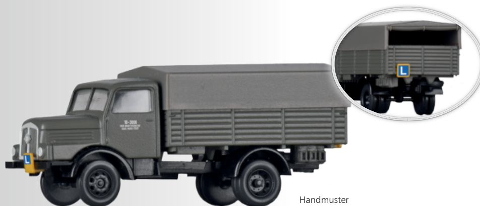
LKW H3A Hochbordpritsche „Fahrschule“ LKW H3A platform / Tarpaulin „Fahrschule“