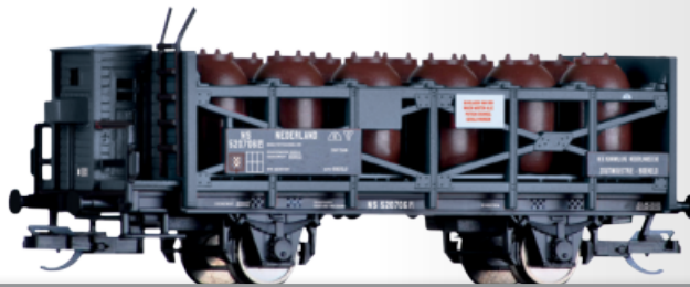
Säuretopfwagen „Koninklijke Nederlandsche Zoutindustrie“, eingestellt bei der NS Acid pod car „Koninklijke Nederlandsche Zoutindustrie“ of the NS