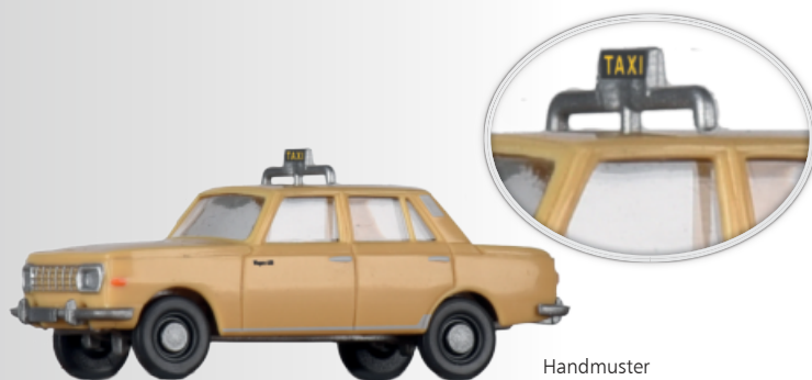
Wartburg 353 „Taxi“ Wartburg 353 „Taxi“