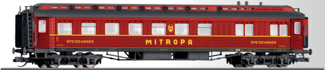
FORMNEUHEIT: Speisewagen „Mitropa“ WR4ü der DR NEW: Dining car “Mitropa” WR4ü of the DR