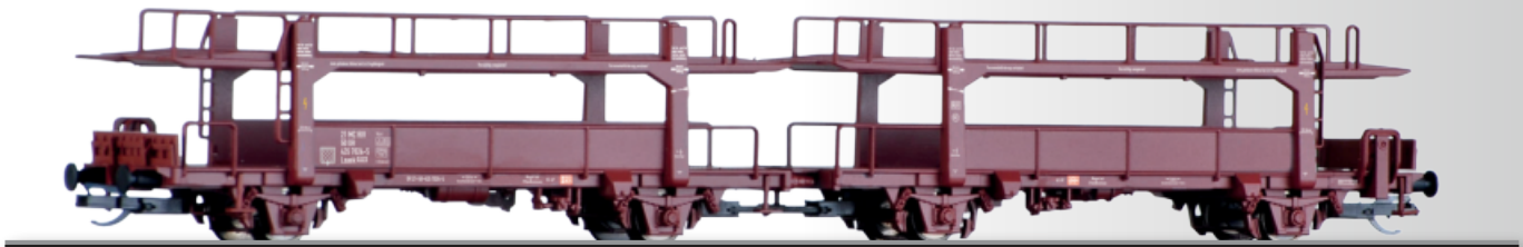
Autotransportwagen-Einheit Laaek 4357 der DR Cars for automobile transport Laaek 4357 of the DR