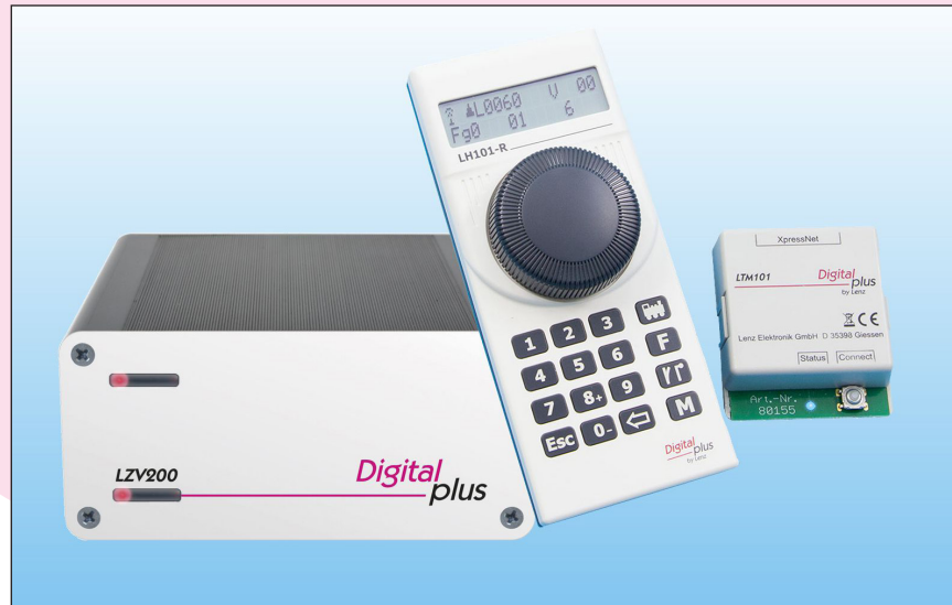
60103 SET101-R Einsteigerset mit LZV200, LH101-R, LTM101

Das SET101-R, die drahtlose Variante, verfügt über den selben Funktionsumfang wie das SET101 und besteht aus der Zentralen-Verstärker-Kombination LZV200 und dem Funkhandregler LH101-R.