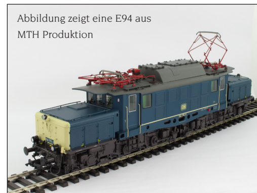
Abbildung zeigt eine E94 aus MTH Produktion