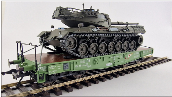
(Der Schwerlastwagen SSy 45 ist nicht im Lieferumfang enthalten.)

47001-01 Panzer Leopard 1 (Exklusiv über den MEG-Shop erhältlich)