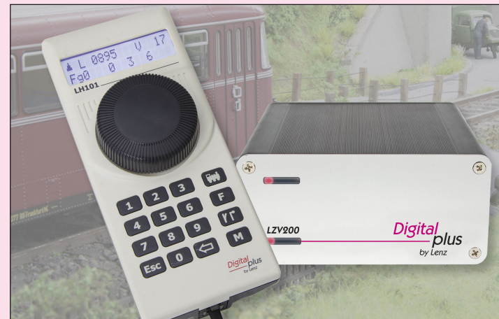
60101 SET101 Einsteigerset mit LZV200 und LH101

und Mehrfachtraktion sind komfortabel einrichtbar. Bis zu 2048 Weichen, Signale und andere Zubehörartikel sind schaltbar, im Handregler können Weichenstraßen abgelegt werden. Einstellungen an Lokdecodern können per PoM oder auf dem Programmiergleis vorgenommen werden. Die LZV200 stellt einen maximalen Strom von 5A zur Verfügung, bei Bedarf kann mit weiteren Verstärkern LV103 erweitert werden.